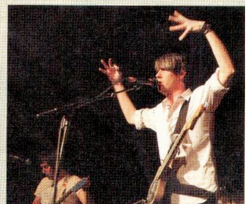
Hi Freaks, Look At Me: Dirk von Lowtzow zelebrierte beim Tocotronic-Konzert den Abschluss seiner Berliner Trilogie