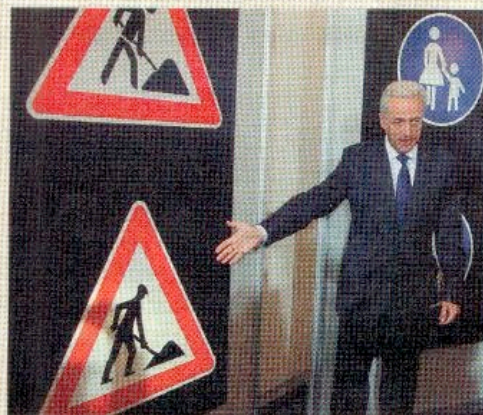
Verkehrsminister Ramsauer hatte zuletzt viel zu tun. Hier erklärt er den Unterschied zwischen alten und neuen Schildern